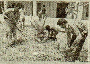
అవరణలోని మొక్కలకు పాదులు కీస్తున్న విద్యార్థులు, అధ్యాపకులు

ఇలా ఉన్న చెత్తా చెదారం, పిల్లమొక్కలు, చిత్తుకాగలను పార, పిశాచి, కొడవళ్లతో గుంటసెప్ప క్రమించి తొలగించారు. అనంతరం వీలు రకాల ఫూలవండ్ల మొక్కలకు పాదులు తీసి సీరుపోశారు.